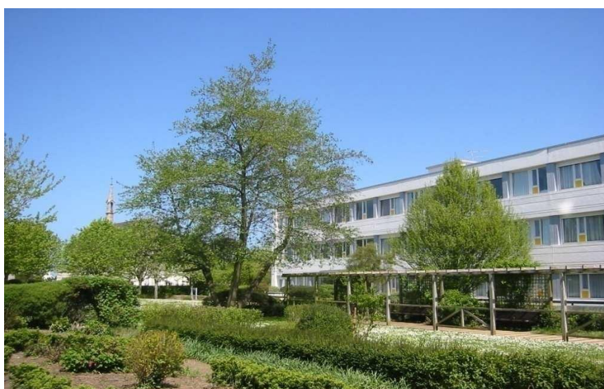
Résidence Ty Maudez