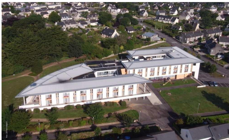
Résidence Le Cleusmeur