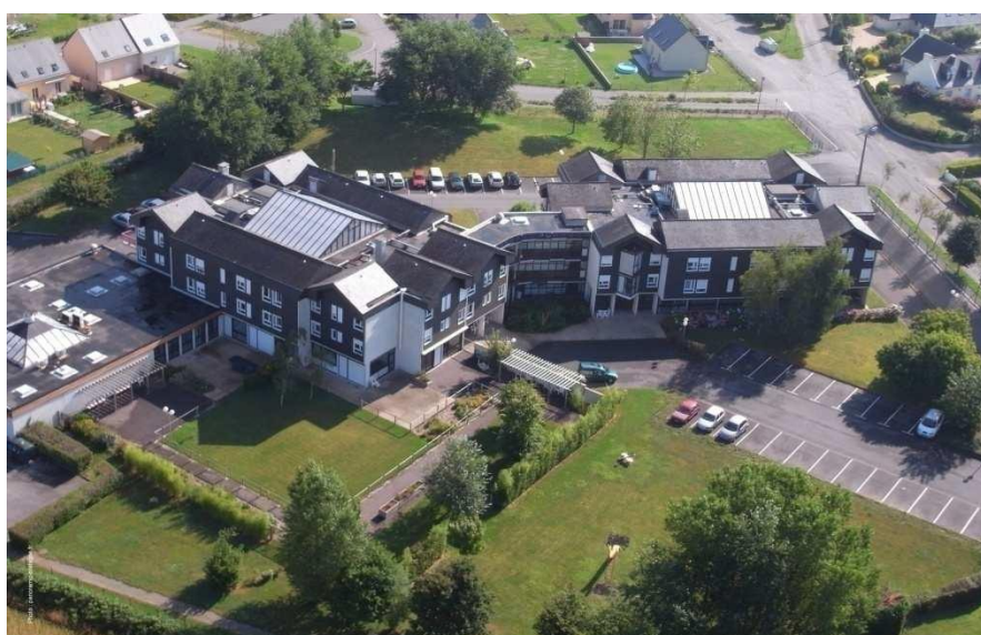
Résidence An Dorquen